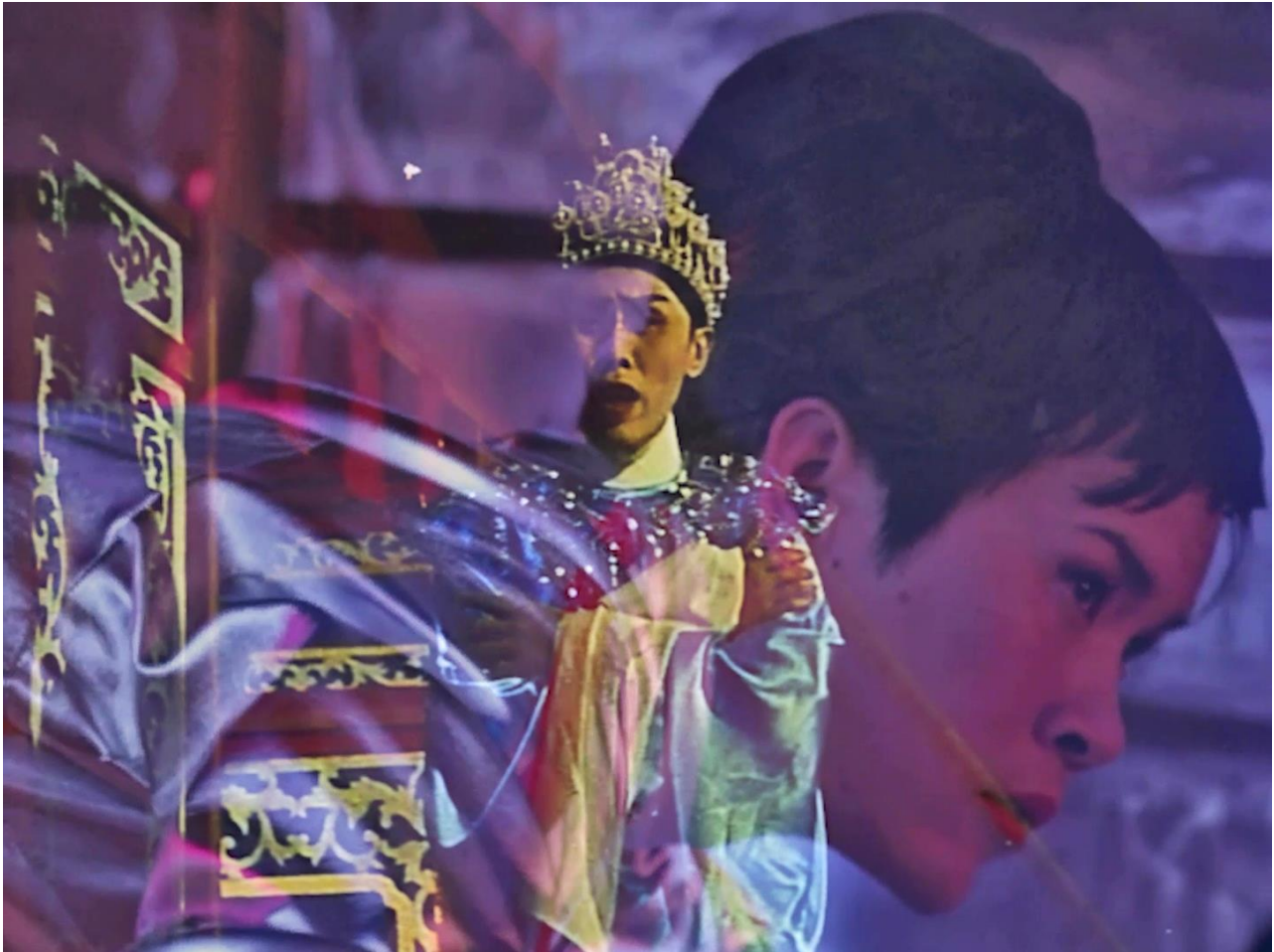
Wayang Spaceship , 2022, Single channel video, 25'00"

Sat. 2 September – Sat. 21 October, 2023 11:00 - 19:00 closed on Sun. Mon. and National Holiday