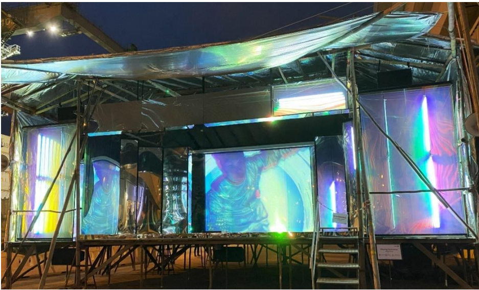
Installation view : Wayang Spaceship , Singapore Art Museum at Tanjong Distripark (Container Bay, Rear Entrance), 2023

The video work presented in this exhibition was first exhibited in Wayang Spaceship , a large-scale outdoor installation commissioned by the Singapore Art Museum in 2022, which Wong created. Here, “wayang” refers to Chinese street opera in Singapore, which is performed on a makeshift wooden stage. It is also used as slang for deliberate theatricality. Next to a container site that hints towards the country's history of development through trade and immigration, Wong had set up a Wayang stage made with metallic, reflective materials that mimic a spaceship. Shown on a screen surrounded by rainbow-coloured fluorescent lights was a video collage that merged Cantonese opera footage from the 1950s to the 1970s with sci-fi films and his own video works. The protagonist, a scholar warrior - Wong's alter ego - embarks on a journey in the Wayang Spaceship through time, space and gender, in a strange trance created by a remix of Cantonese opera music, sci-fi sound effects, and flickering lights.