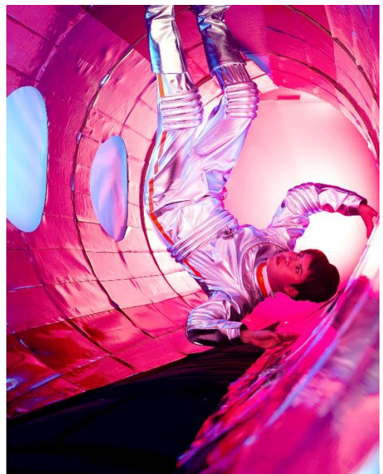
《Astro Girl III》2015年、アーカイバルデジタルプリント、100 x 80 cm

2015年に制作した写真作品《Astro Girl》シリーズは、2014年に香港のオルタナティブ・スペース Para Site で発表した《Windows On The World (Part 1)》から派生したものです。スタンリー・キューブリックの『2001年宇宙の旅』を思わせる宇宙船のセットと、宇宙服に身を包んだウォンが京劇のアリアをバックに船内をゆっくりと歩く映像とで、そのインスタレーションは構成されます。アンドレイ・タルコフスキーの『惑星ソラリス』で、主人公が船内から未知の惑星の海が蠢くのを見たときのように、ウォンが演じる女性宇宙飛行士も不安な面持ちで窓の外を覗き込みます。木材や布という簡易な素材で作られた SF セットで、近未来的京劇が不穏な空気の中繰り広げられる様子は、宇宙に求める進歩や未来のヴィジョンの構築と、京劇に反映される中華圏のアイデンティティの形成とが融合した姿とも言えるかもしれません。