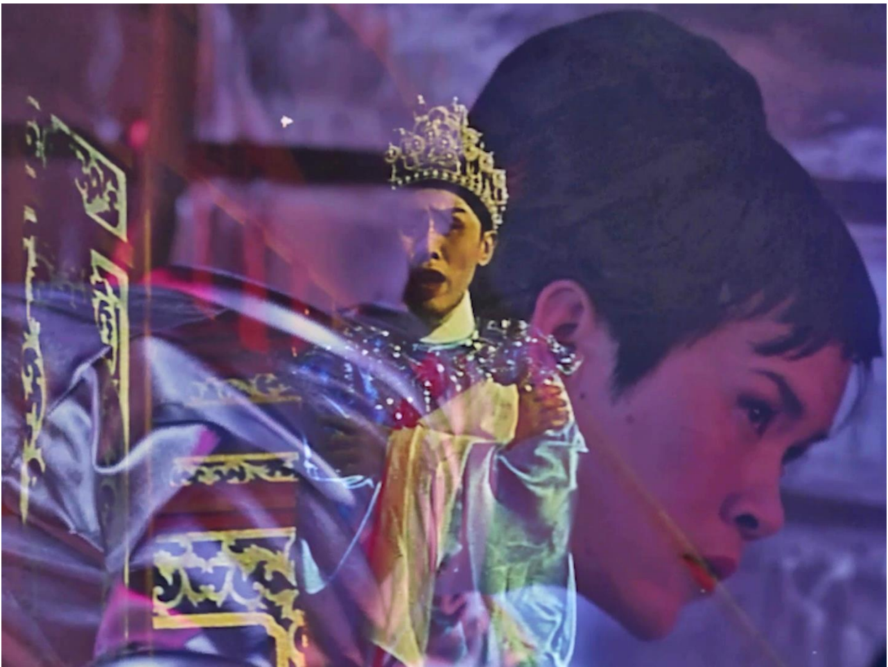
《Wayang Spaceship》2022年、シングルチャンネルビデオ、25' 00"

国際展の準備で多忙な中での来日となります。稀な機会ですのでぜひ取材をご検討ください。