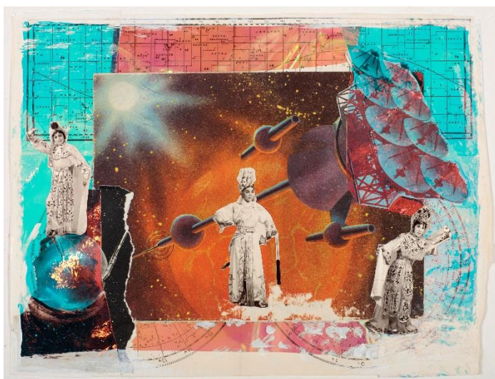
《Number 8 from Pictures from the Wayang Spaceship》2022年 アーカイバルデジタルプリント、150x197.5 cm

今年1月にオオタファインアーツ・シンガポールで行われた個展で発表されたコラージュプリントの新シリーズも、同様に京劇とSFを融合したものです。ウォンは、単色のインクと筆で描いた伝統的な中国のドローイングに、ワヤン俳優のポートレート写真や同時代のソ連のSF雑誌のイラストを組み合わせました。虹色のホログラムで縁取ったコラージュをプリントした作品は、異性装の俳優、学者と戦士のふたつの顔を持つ京劇の伝統的キャラクター、ウクライナの古本屋からポーランドを経由してドイツにもたらされたSF雑誌という、多様なレイヤーが幾重にも重なることで、独特で示唆的なレトロフューチャーを生み出しています。