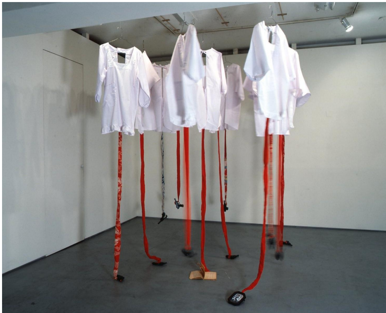
Yoshiko Shimada, Tied to Apron String , 1993, Installation

Sat. 14 March - Sat. 16 May 2026 11:00-19:00 Closed on Sun., Mon. and National Holidays