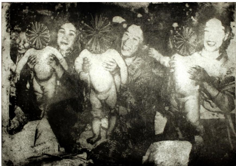
Yoshiko Shimada Baby Contest 1992 Etching 50 x 70 cm

The exhibition titles “Selfless Devotion” and “Loving Care” were phrases that frequently appeared in wartime slogans. These keywords—evoking femininity and motherhood—were embodied by wartime “women's associations” tasked with safeguarding the home front. Among them, the National Defense Women's Association grew into a massive organization of 10 million members. These women carried out their duties clad in their “uniform” of white aprons and sashes. Often depicted as an army devoid of individual will, yet numerous memoirs exist where women—deprived of suffrage, confined to the home, and unable to claim personal time—found liberation and exhilaration in donning the same uniform regardless of social status, enabling “social participation” through national contribution. Women's “self-realization” through “self-sacrifice for the public good” converged into identification with the state.